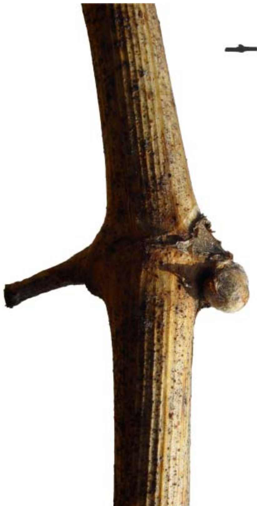
Obr. 4.25 Koniec nadúvania púčikov BBCH 03