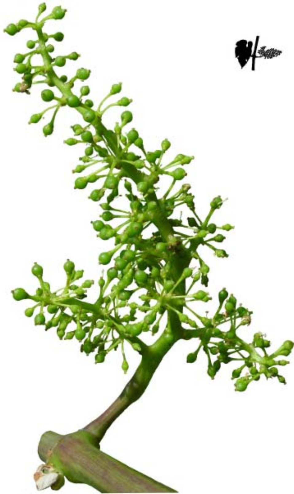
Obr. 4.45 Nasadzovanie plodov - BBCH 71