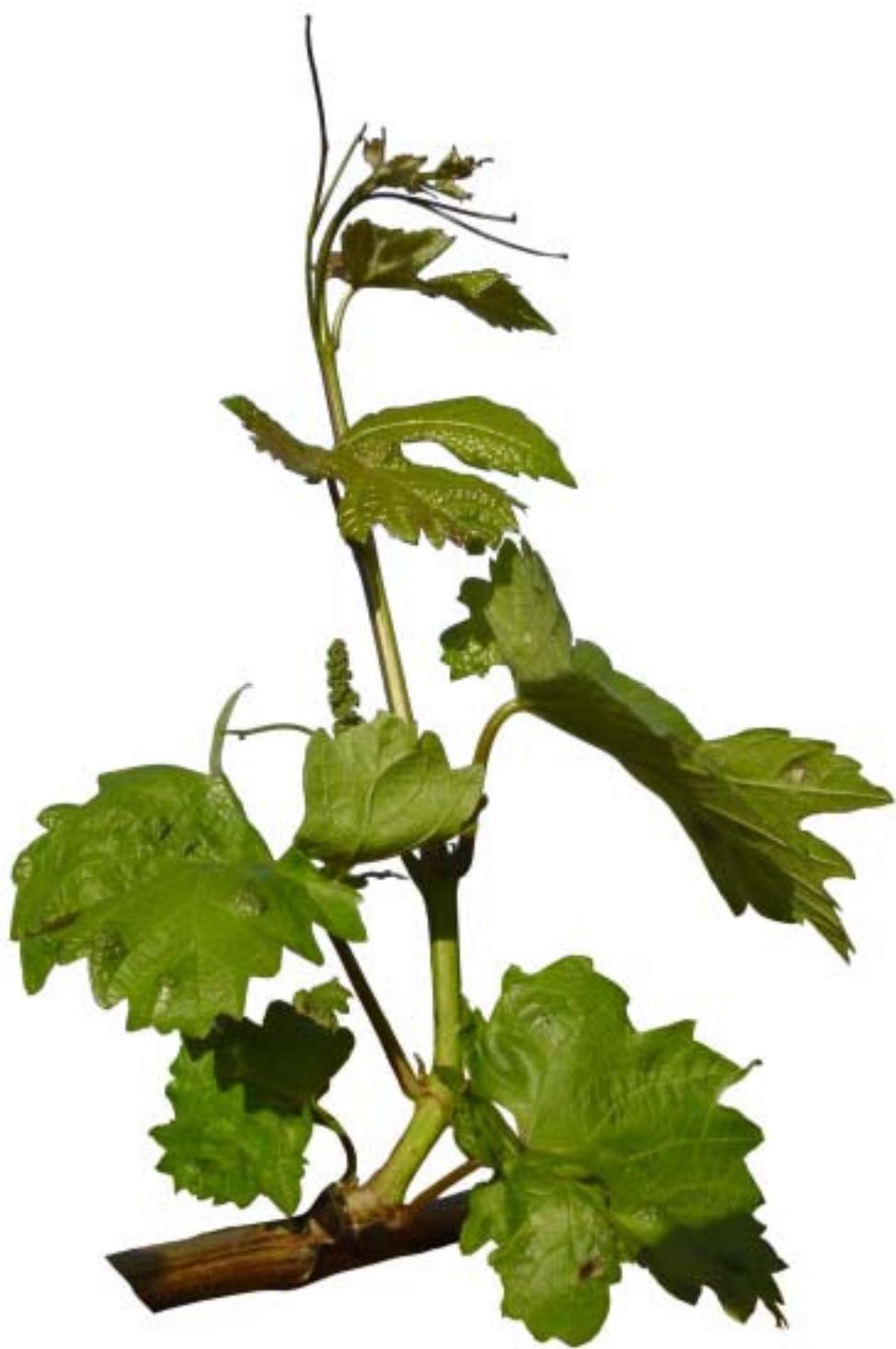
Obr. 4.34 Šiesty list rozvinutý - BBCH 16