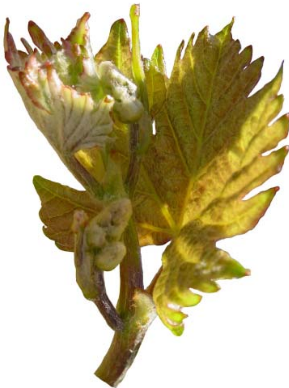
Obr. 4.38 Inflorescencie viditeľné - BBCH 53