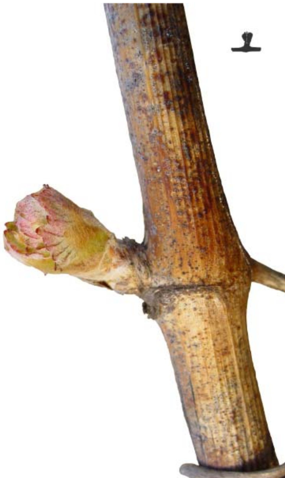
Obr. 4.28 Pučanie - BBCH 08