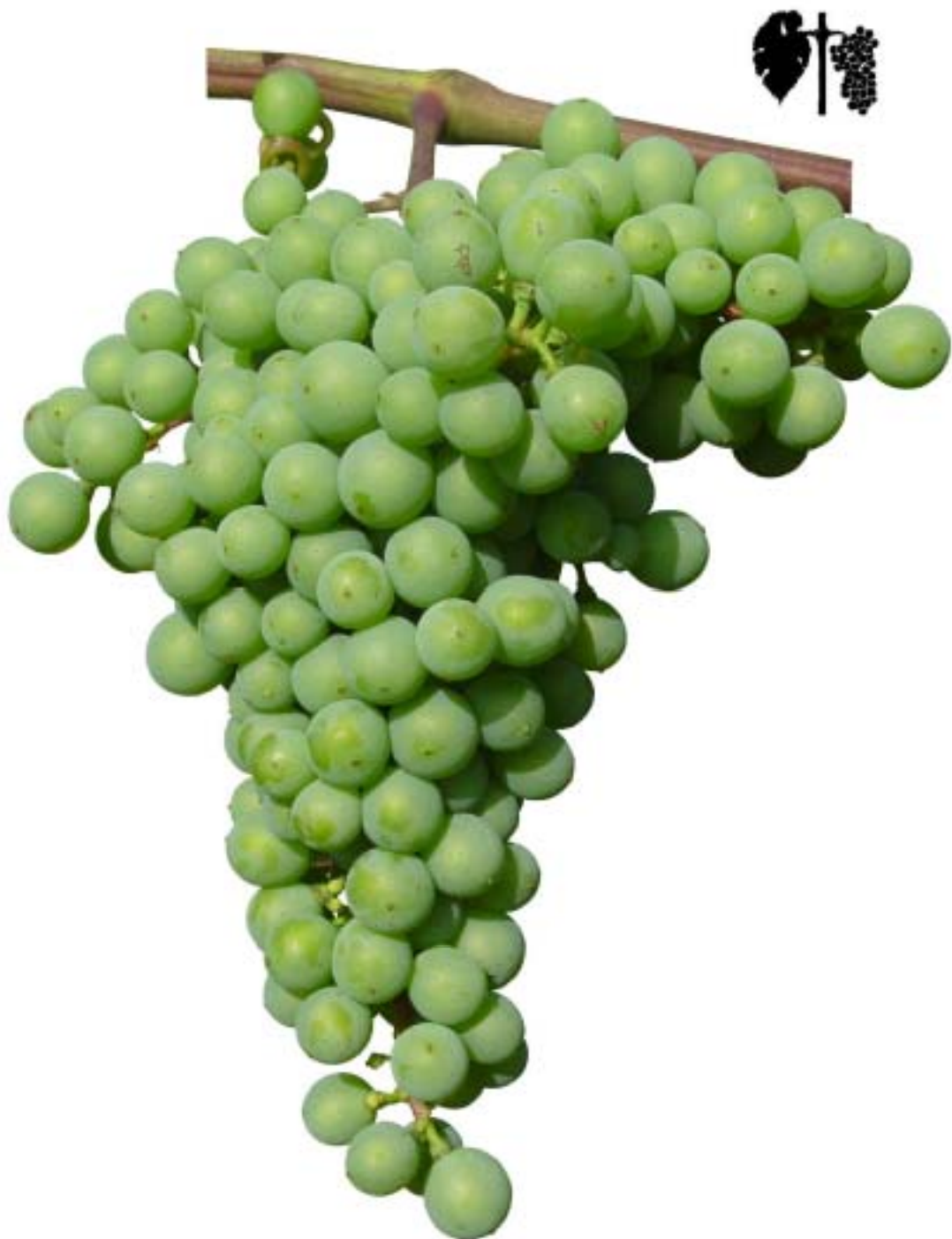
Obr. 4.49 Väčšina bobúľ sa dotýka - BBCH 79