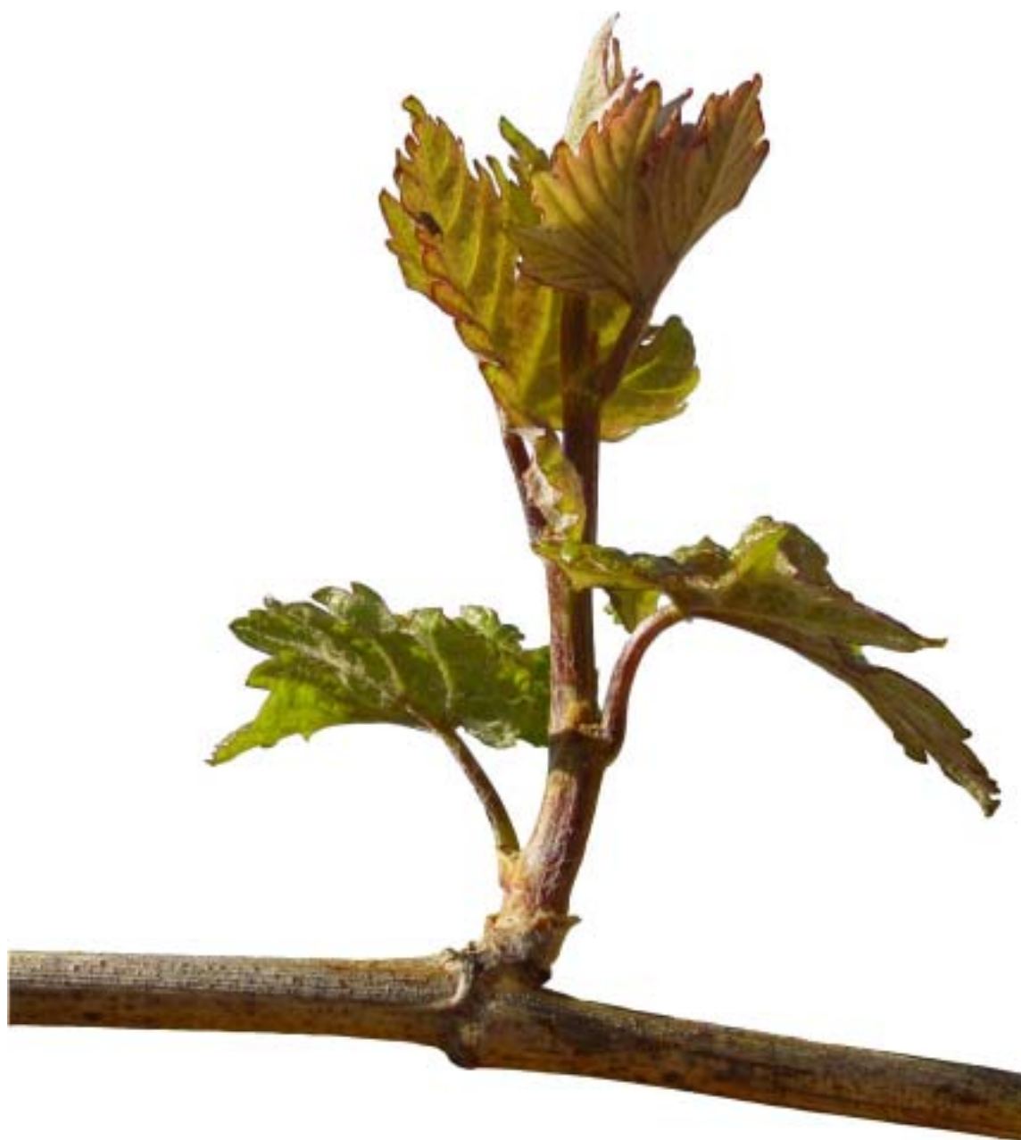
Obr. 4.30 Druhý list rozvinutý - BBCH 12