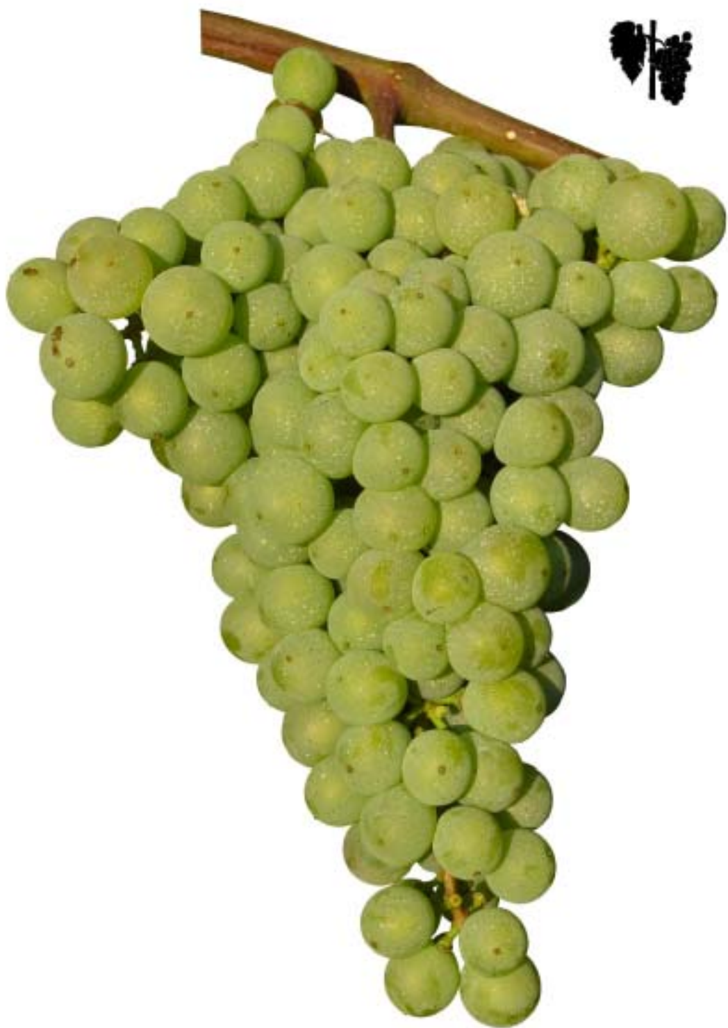
Obr. 4.51 Bobule sa vyfarbujú - BBCH 83