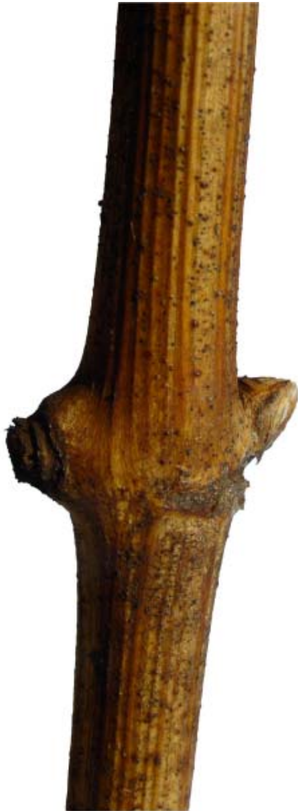
Obr. 4.24 Začiatok nadúvania púčikov - BBCH 01