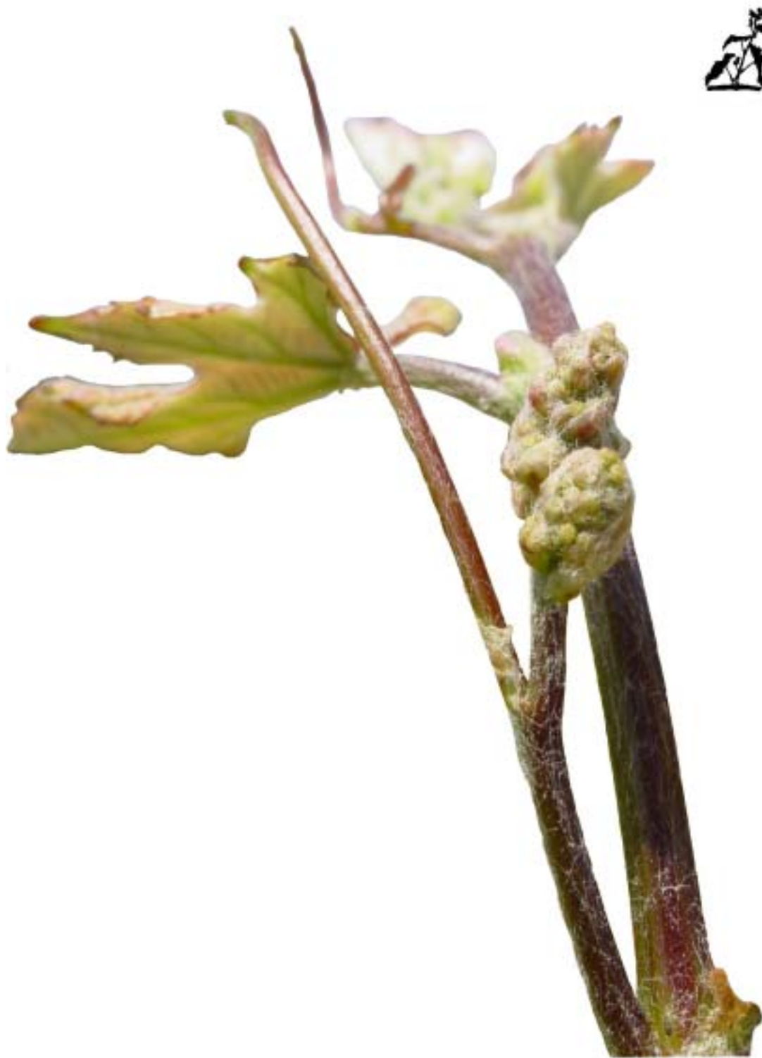
Obr. 4.39 Inflorescencie sa nalievajú - BBCH 55