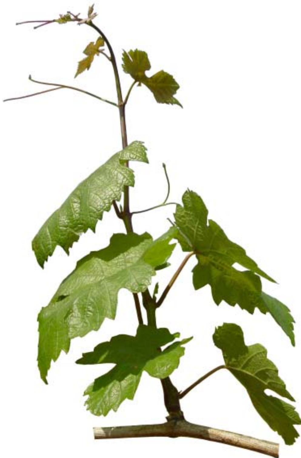
Obr. 4.35 Siedmy list rozvinutý - BBCH 17