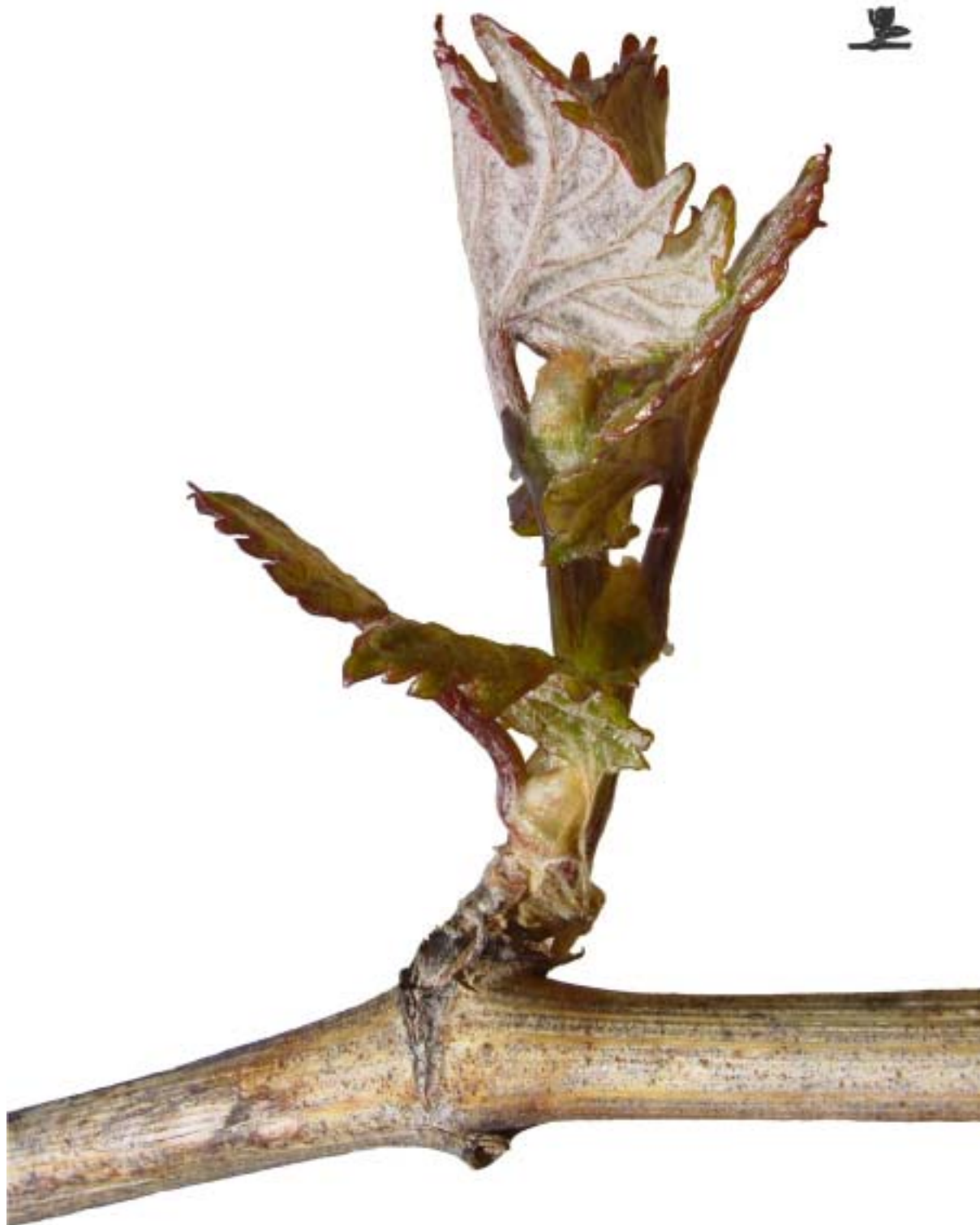
Obr. 4.29 Prvý list rozvinutý - BBCH 11