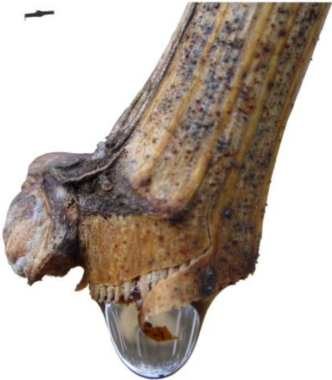
Obr. 4.23 Slzenie - BBCH 00.1