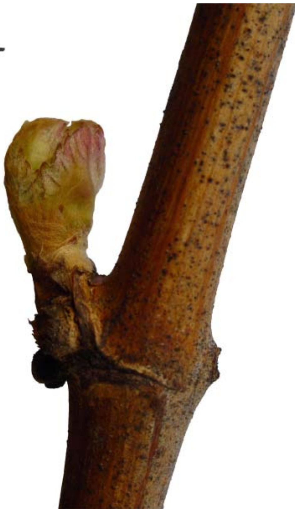
Obr. 4.27 Začiatok pučania BBCH 07