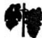
Obr. 4.53 Bobule v zberovej zrelosti - BBCH 89