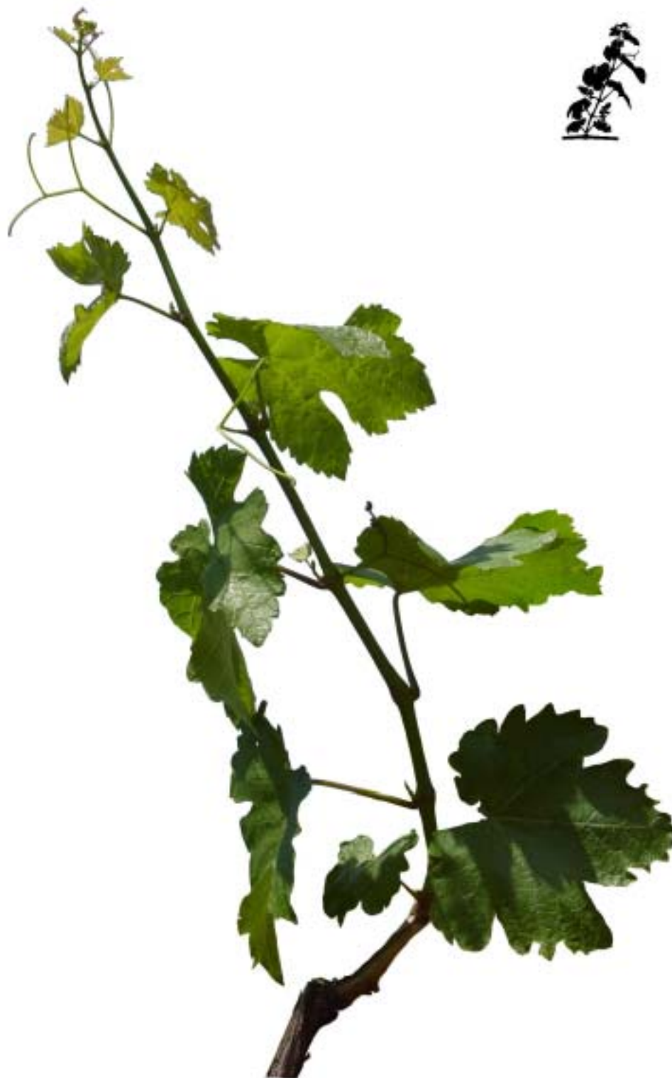
Obr. 4.37 Deviaty list rozvinutý - BBCH 19