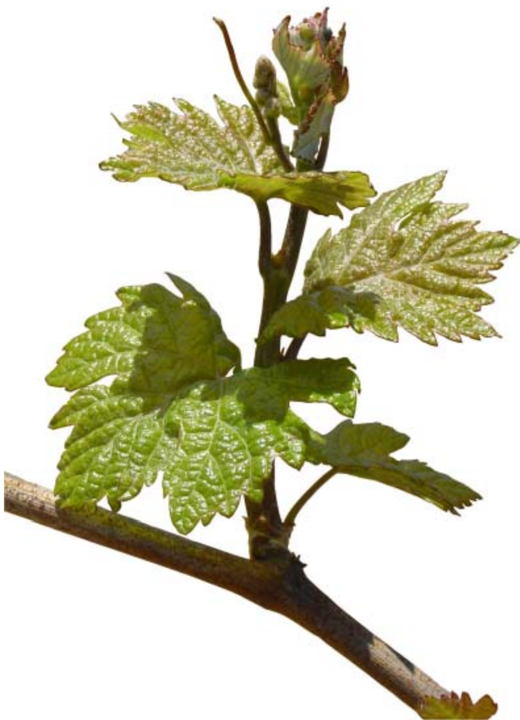
Obr. 4.32 Štvrtý list rozvinutý - BBCH 14