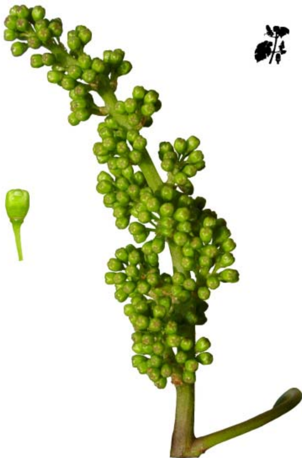
Obr. 4.40 Inflorescencie rozvinuté - BBCH 57