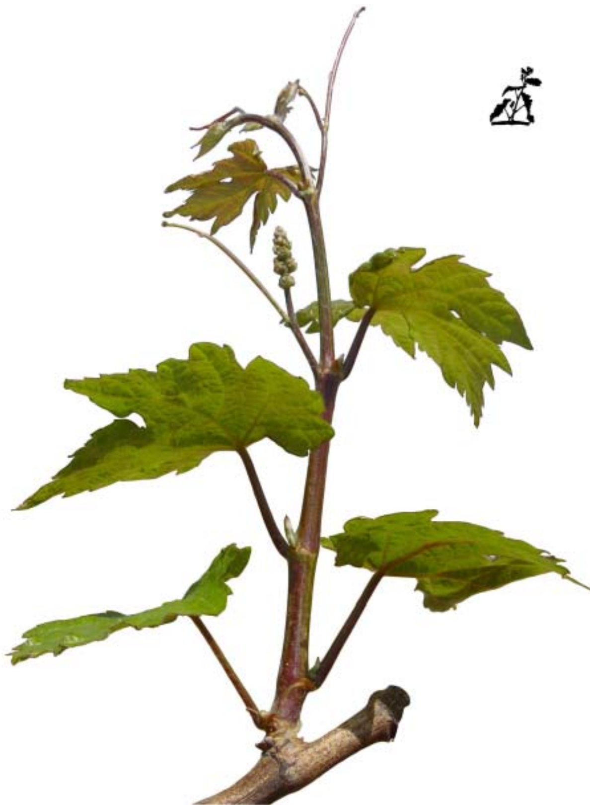
Obr. 4.33 Piaty list rozvinutý - BBCH 15