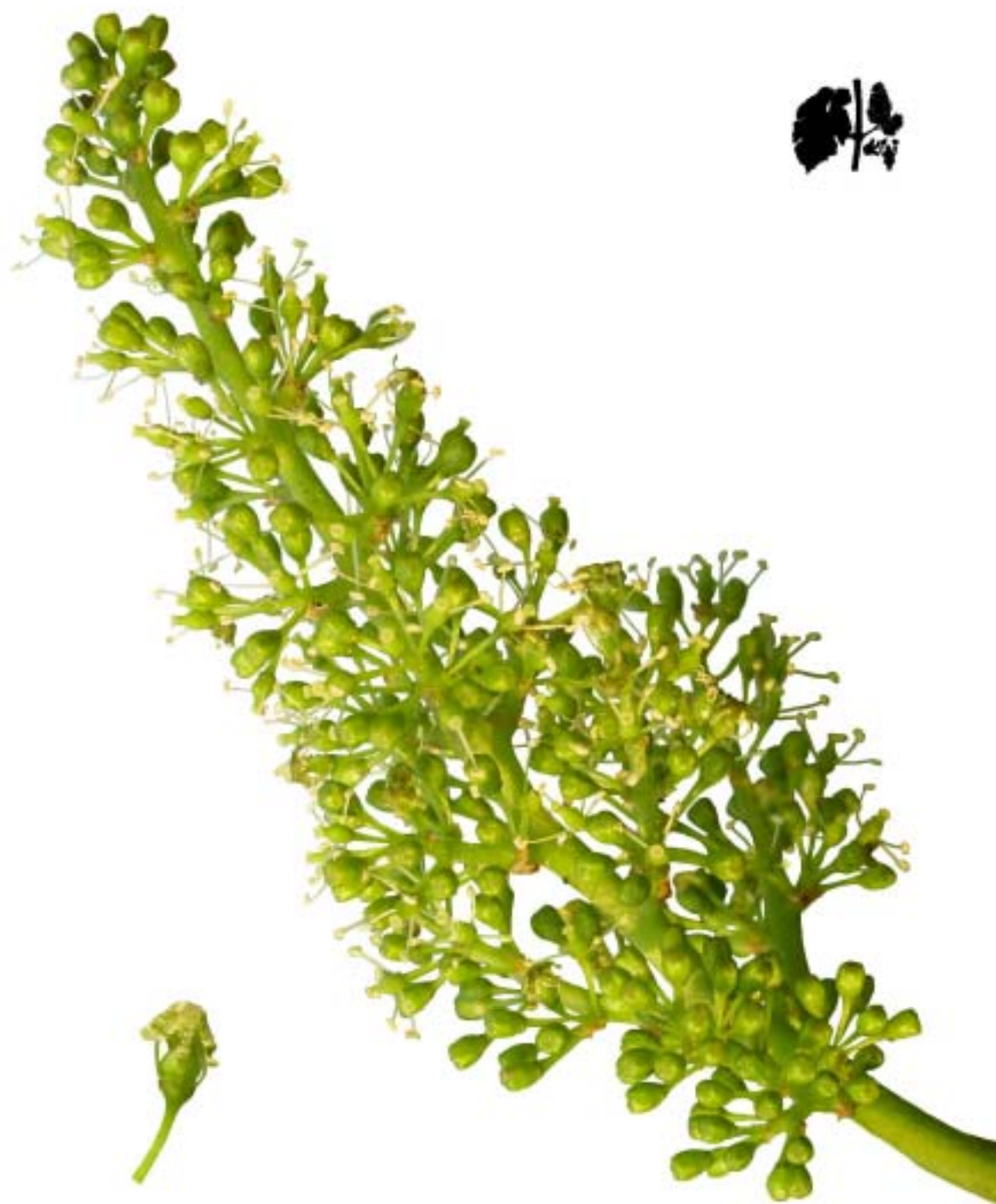
Obr. 4.42 Rané kvitnutie 30% - BBCH 63