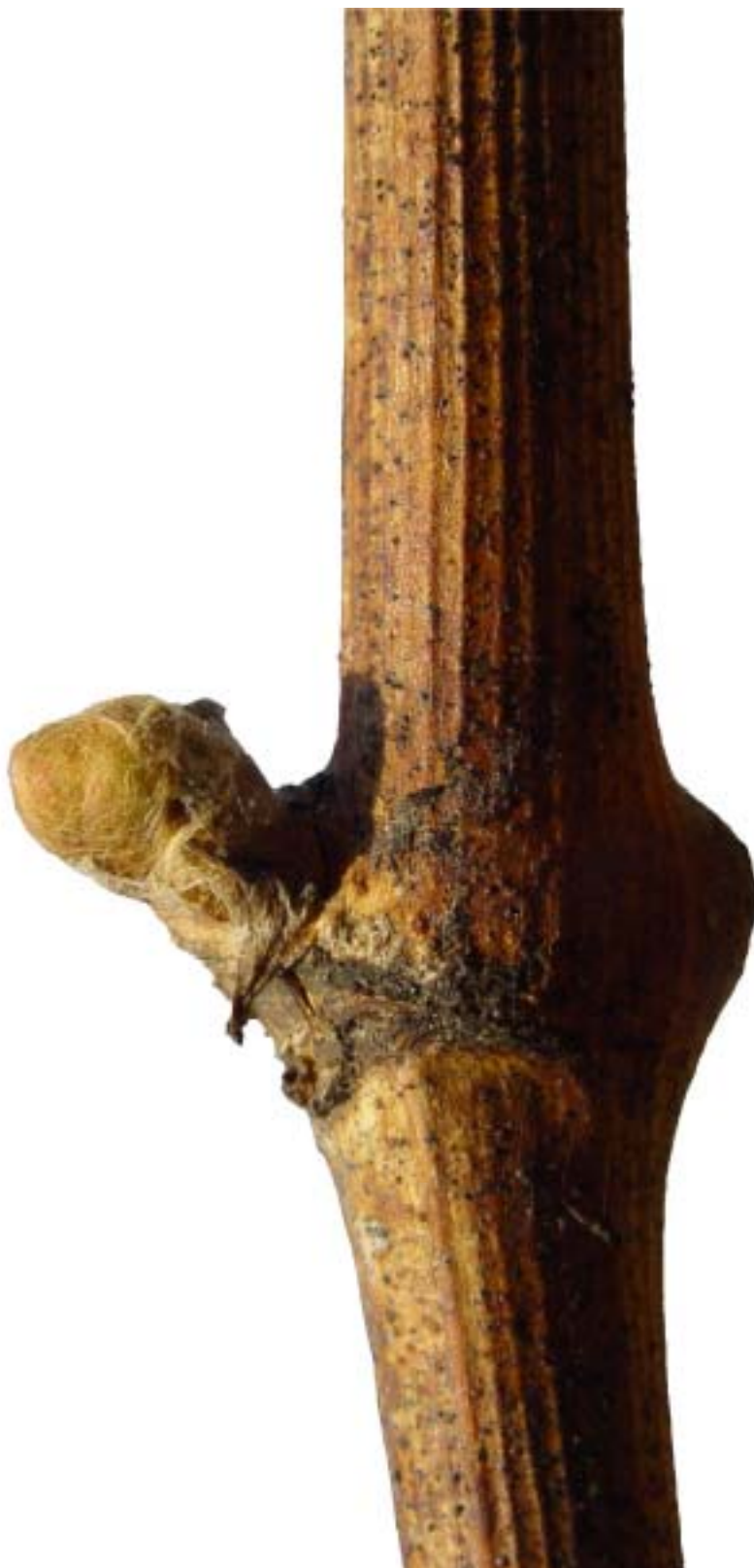
Obr. 4.26 Štádium vatičky - BBCH 05