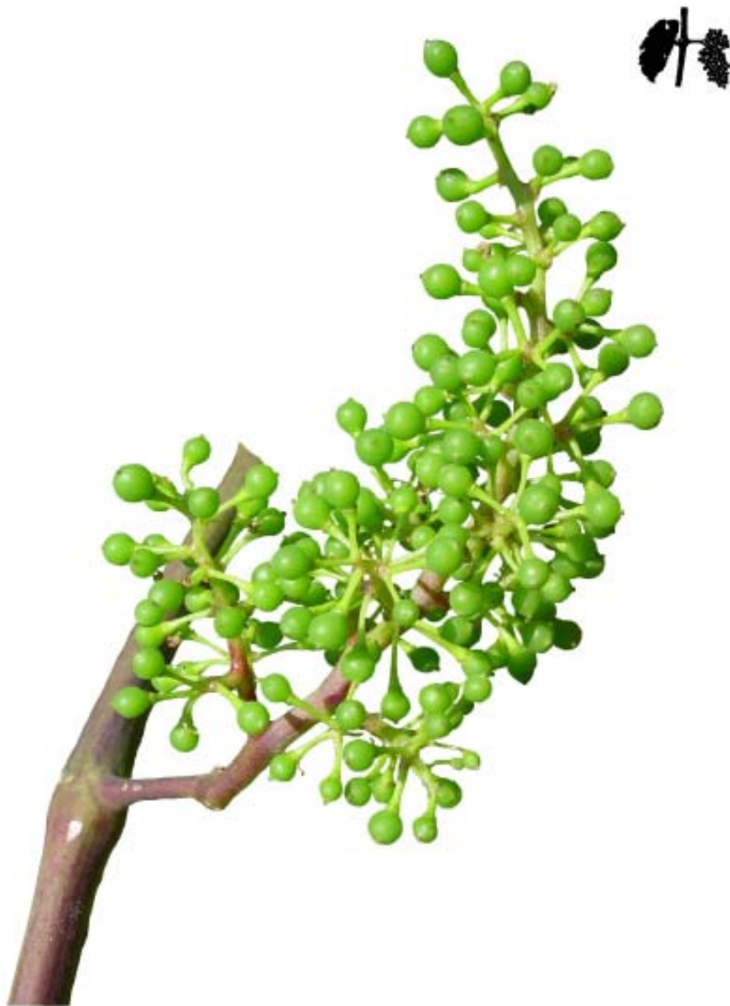
Obr. 4.46 Bobule vel'kosti obilky - BBCH 73