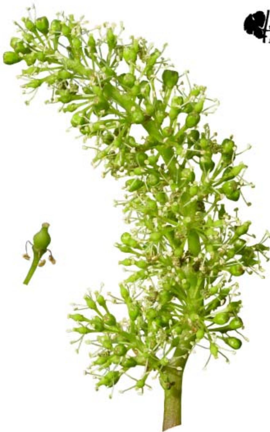
Obr. 4.44 Koniec kvitnutia 80% - BBCH 68