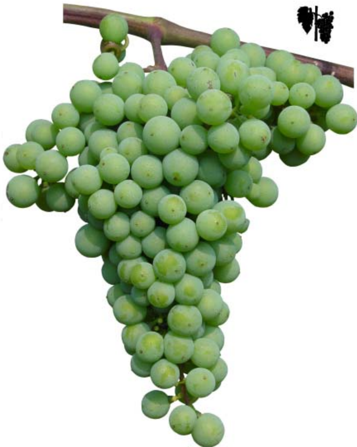
Obr. 4.50 Začiatok dozrievania bobúl' - BBCH 81