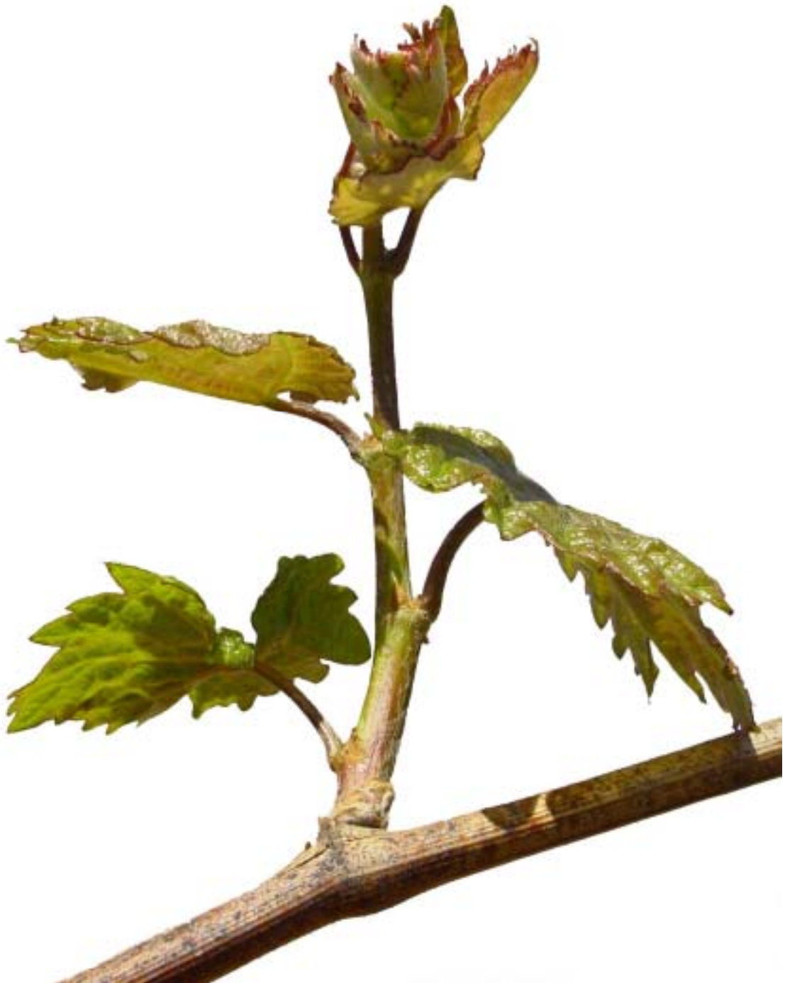
Obr. 4.31 Tretí list rozvinutý - BBCH 13