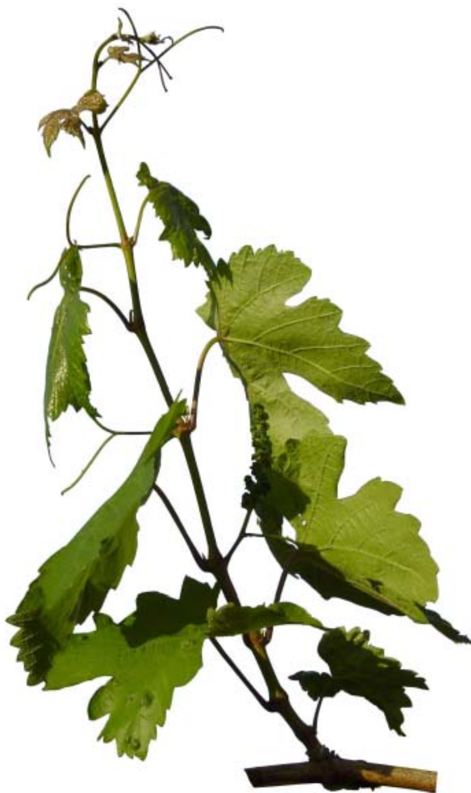
Obr. 4.36 Osmý list rozvinutý - BBCH 18