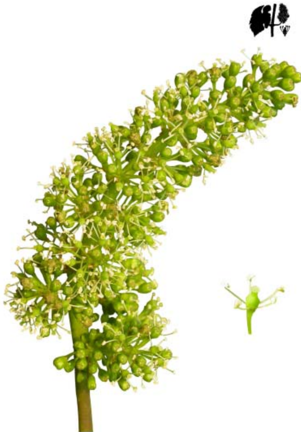
Obr. 4.43 Plné kvitnutie 50% - BBCH 65