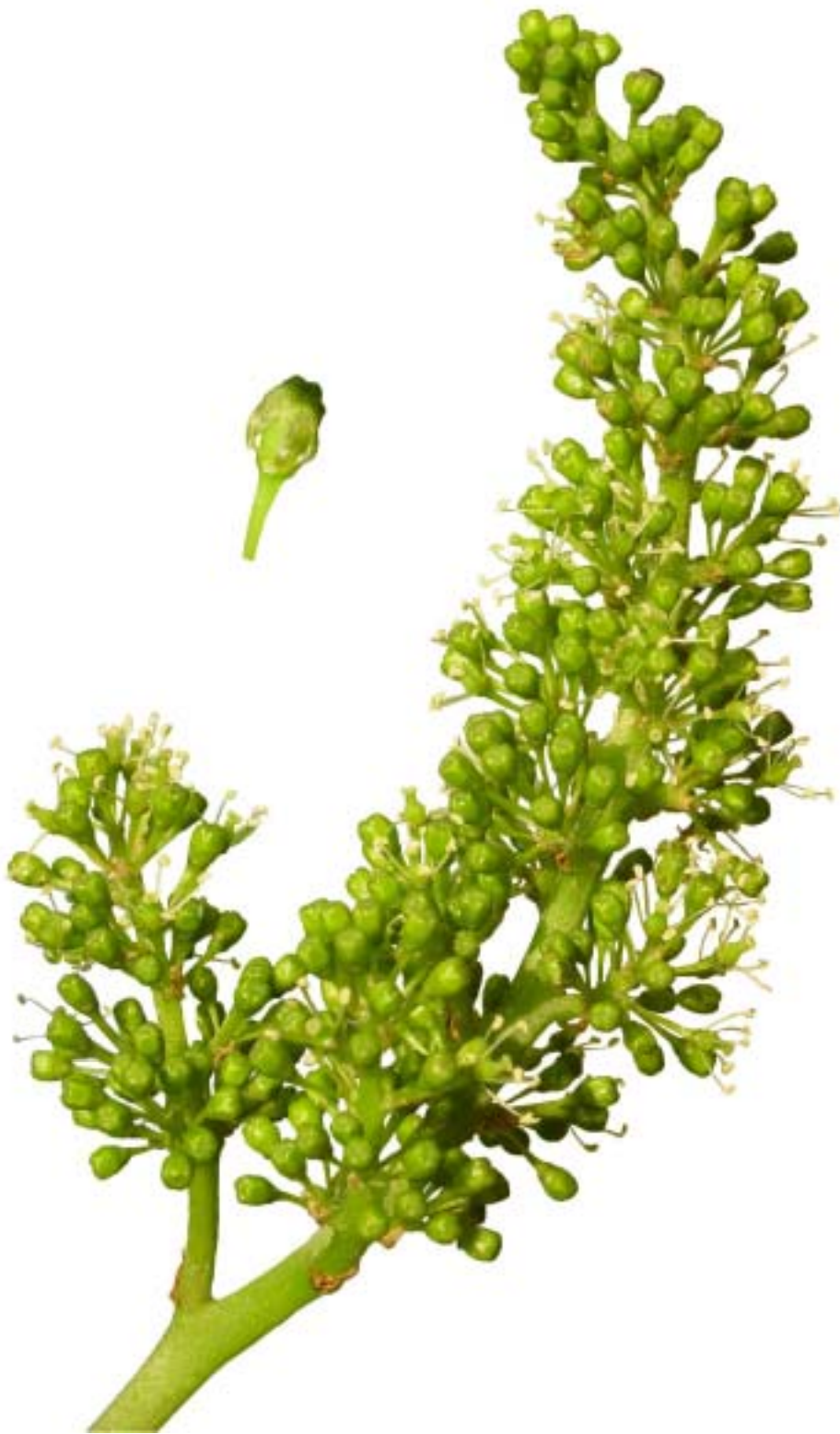
Obr. 4.41 Začiatok kvitnutia 10% - BBCH 61