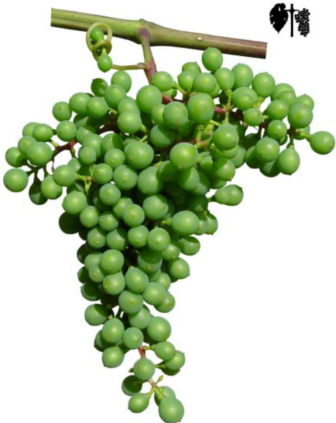
Obr. 4.48 Začiatok dotýkania sa bobúľ - BBCH 77