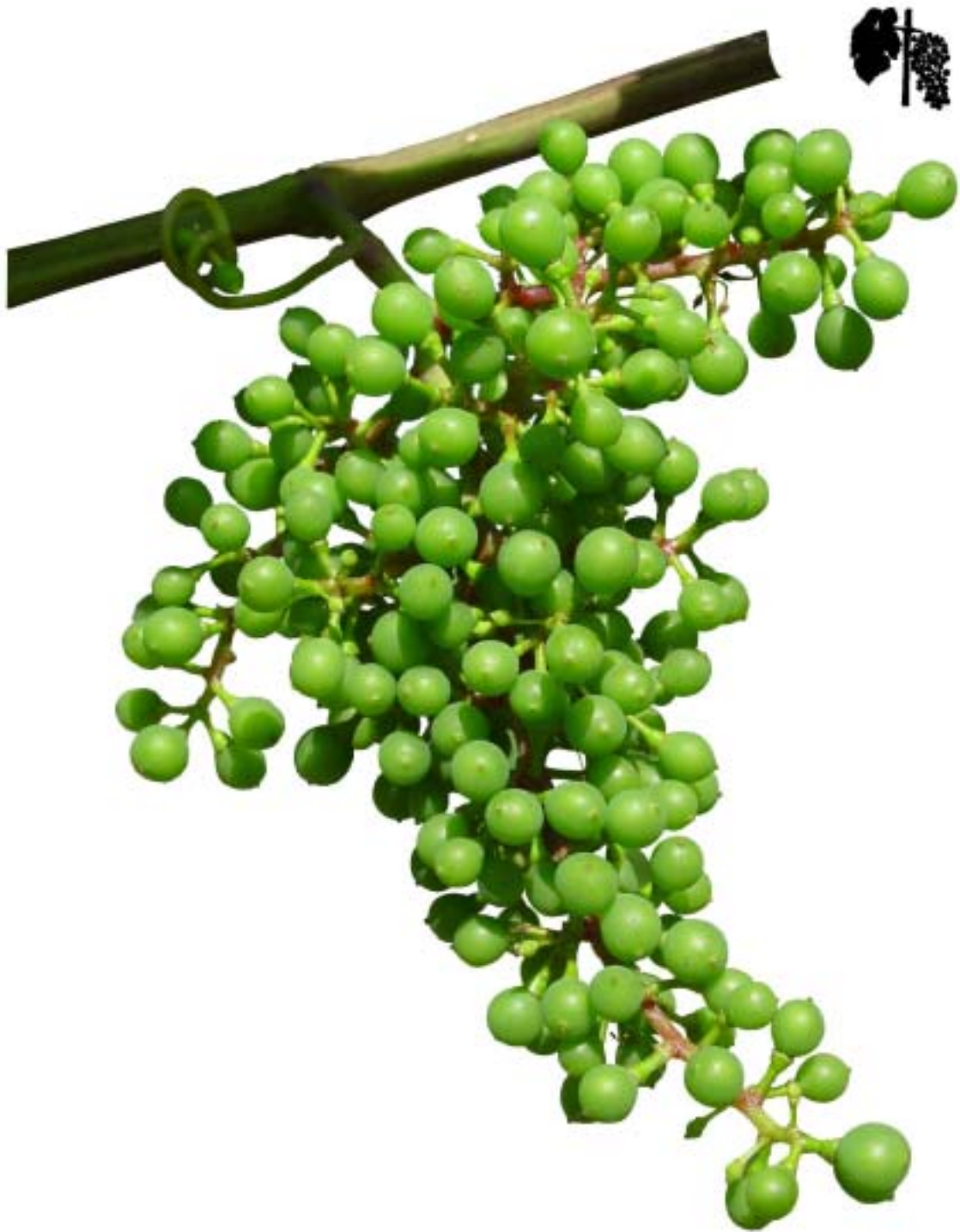
Obr. 4.47 Bobule veľkosti hrachu - BBCH 75