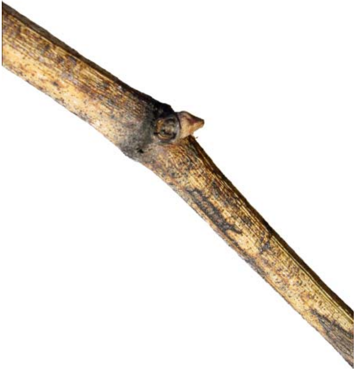
Obr. 4.22 Dormancia - BBCH 00